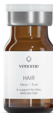
VENOME MESO HAIR