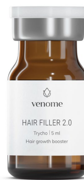
VENOME HAIR FILLER 2.0

Terapia trychologiczna o właściwościach rewitalizujących, łącząca Venome Hair Filler 2.0 oraz Venome Meso Hair , jako wyjątkową kurację dla słabych, nadmiernie wypadających włosów.